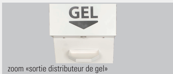
zoom «sortie distributeur de gel»