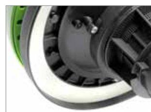
JOINT DE TÊTE NOVATEUR