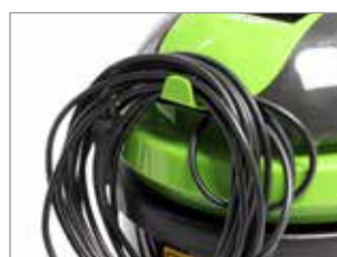
CROCHET POUR CÂBLE