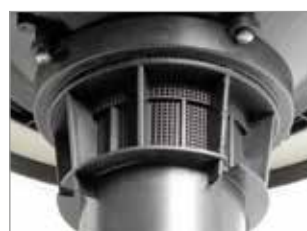
SYSTÈME ANTI-MOUSSE INTÉGRÉ