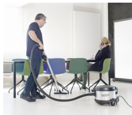
Le VP930 est le choix idéal pour les applications exigeantes comme dans les bureaux, les hôtels et les bâtiments publics