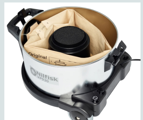
Cuve en métal résistante et sac à poussière de 15 litres