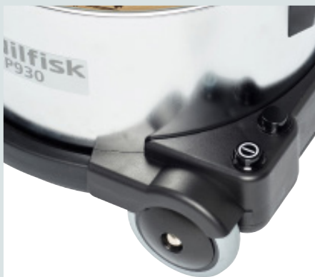
Fonction double vitesse sur certains modèles