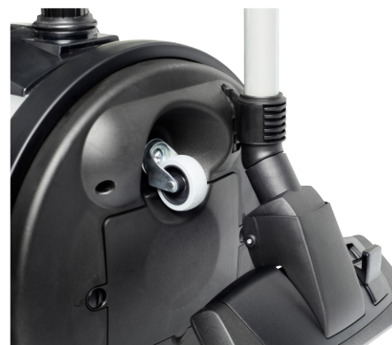
Solution de stationnement en série