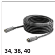
34, 38, 40