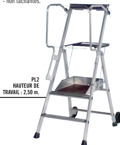
PL2 HAUTEUR DE TRAVAIL : 2,50 m.

▶ Roues de déplacement ø 100 mm : - non porteuses en position de travail. - non tachantes.