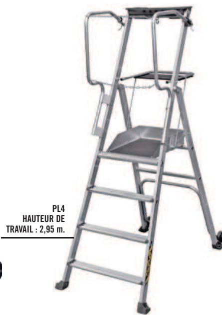
PL4 HAUTEUR DE TRAVAIL : 2,95 m.