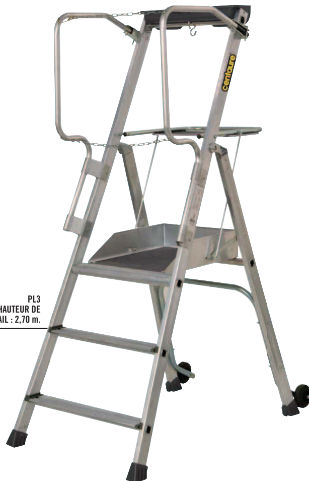
PL3 HAUTEUR DE TRAVAIL : 2,70 m.

▶ Stabilité parfaite sans étayage et largeur produit maîtrisée.