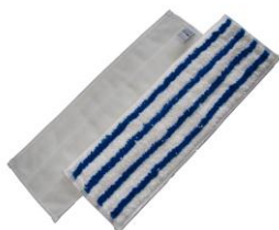
Réf. 615.540.540: Mop grattant 44 x 13 cm blanc/bleu